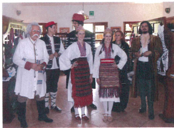
KRABAT mit Graf Zrinski und Frankopan

Dort angekommen staunten wir nicht schlecht als sich plötzlich Graf Peter Zrinski nebst Gattin und Graf Frankopan die Ehre gaben, uns zu begrüßen. Mit so viel historische Prominenz hat wohl selbst unser KRABAT nicht gerechnet, der von dem Besuch seiner ehemaligen Dienstherrn ganz begeistert war.