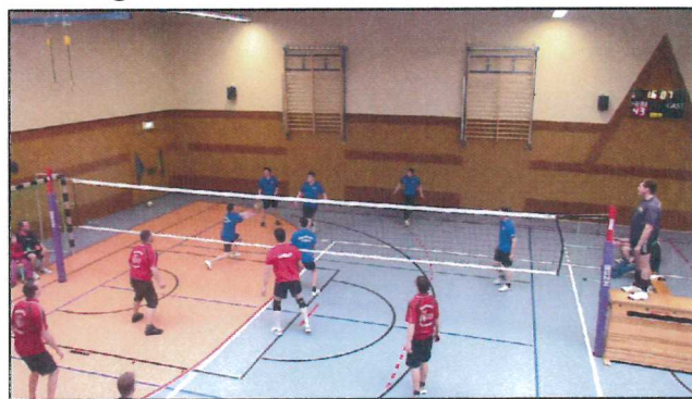
Archivbild vom Turnier 2014

Das diesjährige Volleyballturnier der Freiwilligen Feuerwehren um den Pokal des Bürgermeisters findet am Samstag, dem 21.02.2015 um 15.00 Uhr in die Turnhalle der Sorbischen Schule in Ralbitz statt. Hierzu sind alle Sportbegeisterten eingeladen. Ausgerichtet wird das diesjährige Turnier von der FFW Schmerlitz.