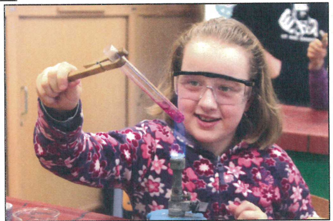
Schülerinnen der 4. Klasse beim Experimentieren im Chemieunterricht