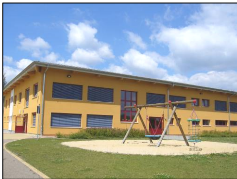
Serbska zakladna šula Ralbicy