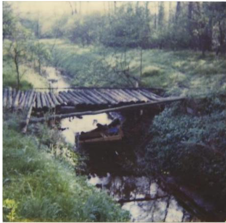
Brücke Laske 26.4.1995