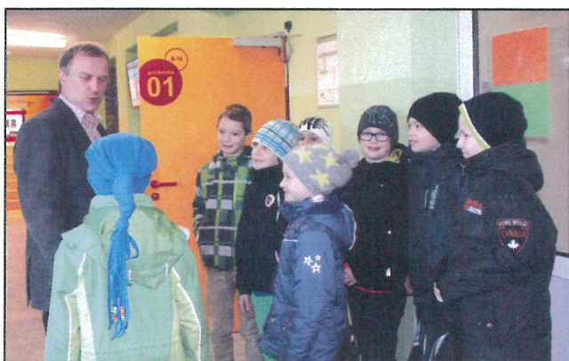
knjaz Korjeńk powita šulerjow z Chróścian zakładneje šule

Mjez druhim wopytachu našich šulerjow při dźěle w chemiji, biologiji, serbšćinje a stawiznach a zeznajomichu so z cyłodnjowskim poskitkom "Tradicionelne a moderne zabawne hry". Wobhladachu sej tež naš Techniski centrum, w kotrymž steji moderna kuchnja ze 16 dźětowymi městnami. W přizemi stej rumnosći za techniske a ručne wukubłanje. Šulerjo 8. lětnika zhotowichu mały přikusk za našich hosći.