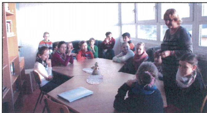
knjeni Jancyna předstaji šulsku biblioteku