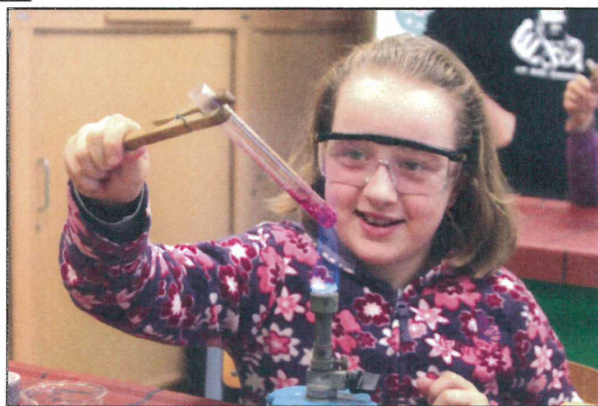
šulerki eksperimentuja w hodźinje chemije