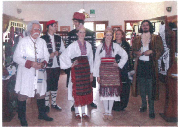
KRABAT mit Graf Zrinski und Frankopan

Dort angekommen staunten wir nicht schlecht als sich plötzlich Graf Peter Zrinski nebst Gattin und Graf Frankopan die Ehre gaben, uns zu begrüßen. Mit so viel historische Prominenz hat wohl selbst unser KRABAT nicht gerechnet, der von dem Besuch seiner ehemaligen Dienstherrn ganz begeistert war.