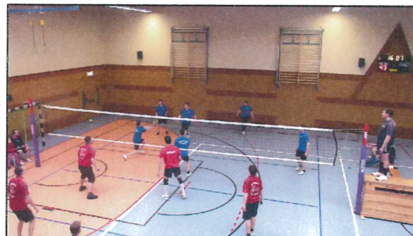
hra lońšeho volleyballoweho turněra