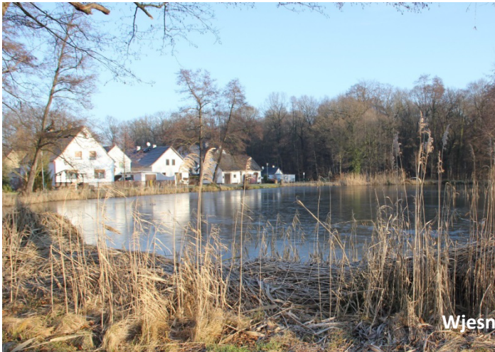
Wjesny hat 2016