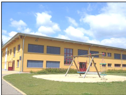
Serbska zakladna šula Ralbicy