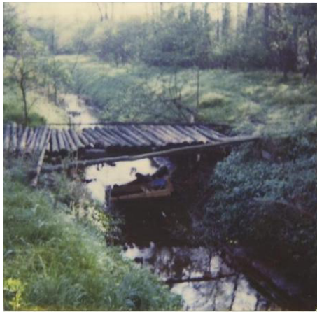
Brücke Laske 26.4.1995