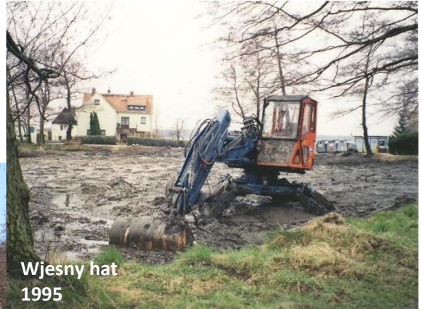
Wjesny hat 1995